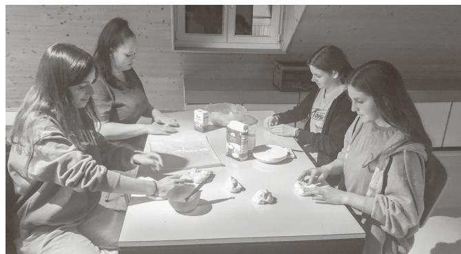
Backen im Jugendtreff

18.00 - 20.00 Oberstufentreff King's Club Ort: Kirchgemeindehaus Weiningen