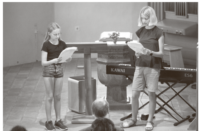
Populärmusik-Gottesdienste in Weiningen (oben) und in Uesslingen