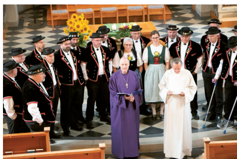
Ökum. Erntedank-Gottesdienste in Uesslingen und Weiningen

Bitte mailen Sie Beiträge für die nächste Beilage zum Kirchenbote bis 3. Januar 2024 an sekretariat@evang-warth-weiningen.ch . Vielen Dank im Voraus.